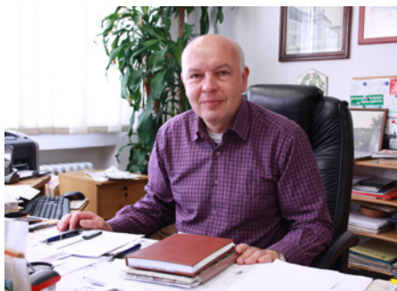
Mgr. Zdeněk Pánek starosta města Bystřice pod Hostýnem